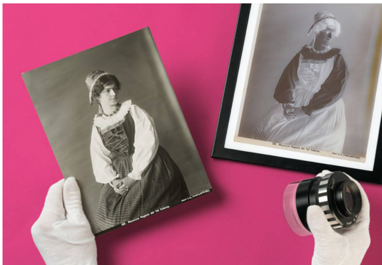
Casa editrice di cartoline Wehrli AG

Sulla piattaforma Wikimedia Commons (WMC) sono state caricate oltre 13 000 fotografie liberamente accessibili, aumentando così il loro numero complessivo a 38 000. Il numero di accessi ha registrato una incoraggiante progressione, passando da 16,8 milioni nel 2023 a 20,5 milioni nel 2024. A questa elevata fruizione ha contribuito anche un evento GLAM on tour di due giorni, organizzato insieme a Wikimedia CH nel giugno del 2024 e incentrato sulle immagini digitalizzate dell'archivio della casa editrice di cartoline Wehrli AG , che 100 anni fa si è fusa con Photoglob.