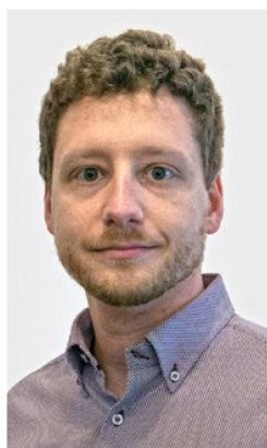
Raphaël Scacchi Autore del romanzo Arancione vendemmia