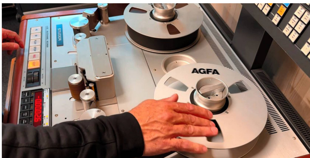
La macchina sonora del mese

Nell'anno in rassegna la Fonoteca ha rafforzato la propria rete nazionale e internazionale partecipando a vari colloqui e congressi. A giugno ha preso parte al convegno annuale della Audio Engineering Society (AES) a Culpeper (VA, USA), a luglio al gruppo di lavoro AG-AV (Arbeitsgruppe Audiovisuelle Ressourcen) a Francoforte e a settembre al congresso annuale dell'Associazione internazionale degli archivi sonori e audiovisivi (IASA) a Istanbul. A Culpeper la Fonoteca ha organizzato un laboratorio sul restauro delle cassette DAT, mentre al congresso IASA ha presieduto la riunione del comitato per la formazione e il perfezionamento e successivamente presentato l'istituzione e le sue attività. I convegni hanno visto la partecipazione di specialiste e specialisti dell'audiovisivo provenienti da ogni parte del mondo.