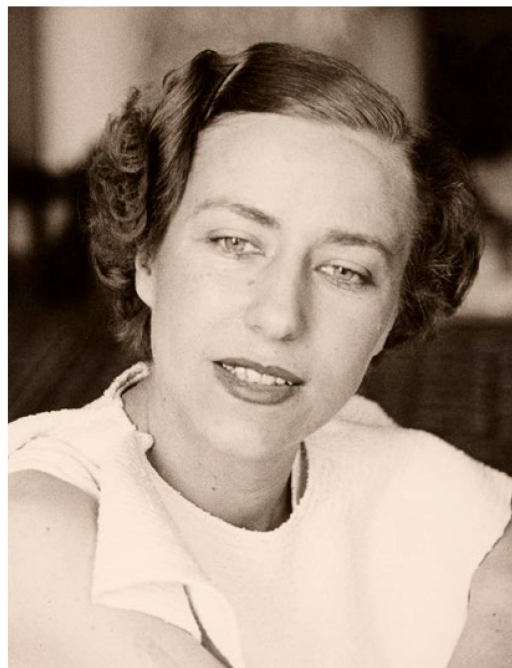
Alice Rivaz Fotografia scattata da sua madre Ida-Marie Golay, 1936/37

Sempre sul proprio sito la Fonoteca ha presentato le raccolte fonografiche di varie personalità di spicco della cultura svizzera, come la scrittrice ginevrina Alice Rivaz (1901–1998) e lo scrittore ticinese Francesco Chiesa (1871–1973). Ha inoltre pubblicato un'ampia intervista in esclusiva con lo scrittore ticinese Raphaël Scacchi (*1992) e lo studioso Stefano Boumya (*1993) a proposito del romanzo di Scacchi Arancione vendemmia .