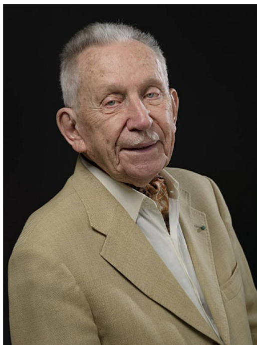
Julien-François Zbinden Compositore e pianista jazz

Lugano il GLAM on Tour , un evento sul tema Swiss National Sound Archives organizzato in collaborazione con Wikimedia CH.