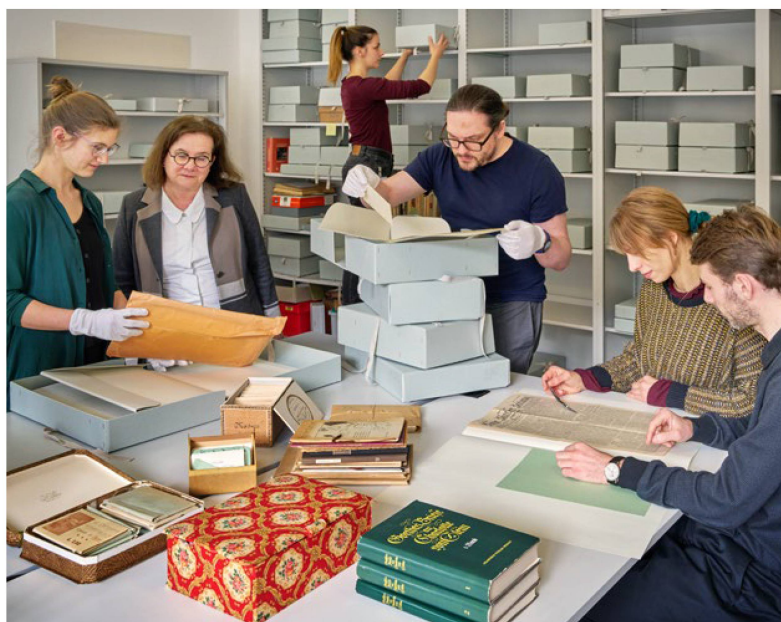
Criptofilologia. La scienza «sotterranea» di Jonas Fränkel Il team del progetto Jonas Fränkel al lavoro

ottobre le studentesse e gli studenti di dottorato e postdottorato hanno iniziato ad analizzare la biblioteca e il lavoro filologico di Jonas Fränkel, prendendo in esame anche la co-autorialità, gli scambi critici e la consapevolezza archivistica condivisi con il premio Nobel Carl Spitteler. Parallelamente, è in corso la catalogazione del lascito e della biblioteca, per la quale è stata effettuata una proficua raccolta fondi. Nel progetto è stato coinvolto anche il collegio Walter Benjamin dell'Università di Berna. La collaborazione scientifica nell'ambito dei lasciti d'importanza internazionale e la promozione di giovani ricercatrici e ricercatori da parte di archivi e università non sono più limitate a casi isolati, e questo ormai da tempo. Lo dimostrano i primi risultati del progetto del FNS Lectures Jean Bollack , realizzato in collaborazione con l'Università di Friburgo e con l'Università di Osnabrück, nella nuova Serie Bollackiana 01: Lire Jean Bollack lesen .