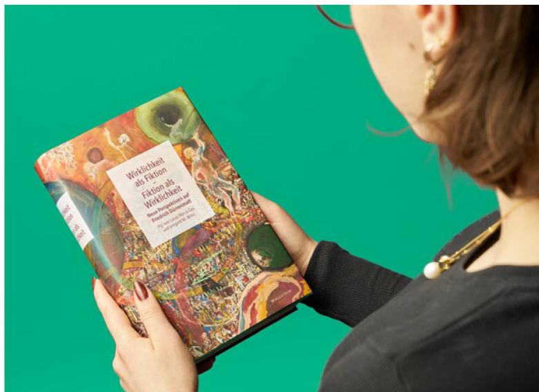
Wirklichkeit als Fiktion. Fiktion als Wirklichkeit. Nuove prospettive su Friedrich Dürrenmatt

Alla fine del 2023 è stato ultimato il volume del convegno Wirklichkeit als Fiktion. Fiktion als Wirklichkeit. Neue Perspektiven auf Friedrich Dürrenmatt . Attraverso 30 contributi e colloqui tratti dall'anno del giubileo 2021 e numerose immagini dell'opera artistica di Friedrich Dürrenmatt, il volume permette di esaminare da nuove prospettive il lavoro dello scrittore e pittore.