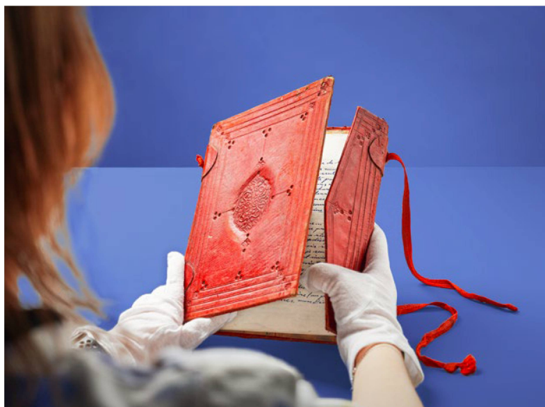
Isabelle Eberhardt Cartella proveniente dalla collezione Isabelle Eberhardt