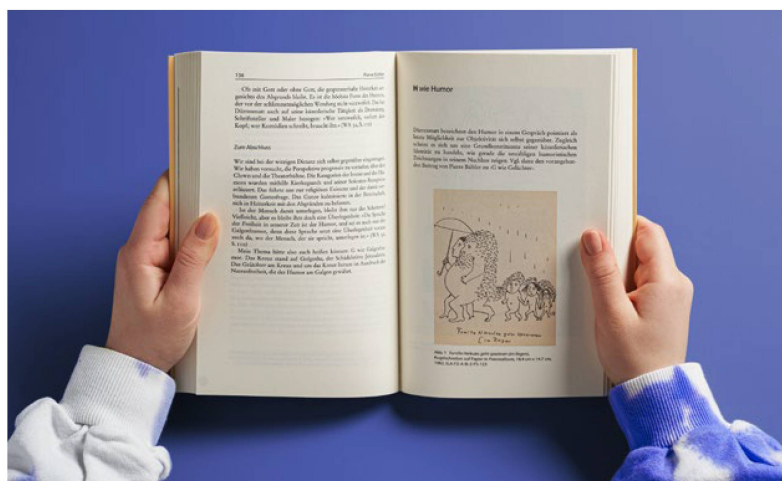
Dürrenmatt von A bis Z Pubblicazione Dürrenmatt von A bis Z. Eine Fibel zum Werk , 2022