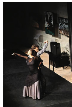
Spettacolo di flamenco contemporaneo Los Laberintos de Dürrenmatt (30.–31.3.2019)