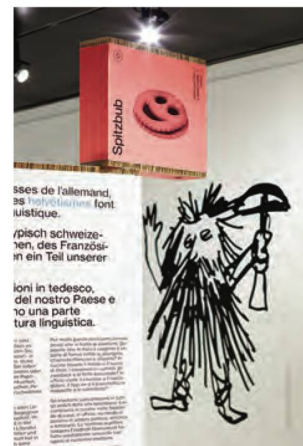
Dettaglio della mostra Elvetismi – Specialità linguistiche al CDN (14.4.–21.7.2019)

L'anno si è concluso con un bilancio eccellente: le mostre e le manifestazioni hanno registrato un'ottima affluenza di pubblico, la mediazione culturale si è sviluppata positivamente e le attività del CDN hanno potuto contare su un'ampia copertura mediatica, che in alcuni casi ha travalicato i confini nazionali. Il CDN ha accolto 12 300 visitatori, una cifra tra le migliori mai registrate dalla sua inaugurazione.