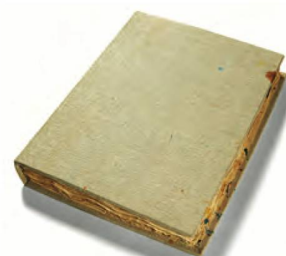
La discreta copertina del libro di Christoph Hauri Grosses Malbuch , libro d'artista, esemplare unico, 2003

16 scatti in bianco e nero di ghiacciai svizzeri in stampa vintage ai sali d'argento (2014–2016). Ed. n. 1/2 (2018/2019). Lavoro fotografico in serie basato sulle opere di Daniel Dollfuss-Ausset: collezione di 28 dagherrotipi che rappresentano le più antiche eliografie delle Alpi, riprodotti in fotografie e accompagnati da estratti dei materiali usati per lo studio dei ghiacciai avviato nel 1893.