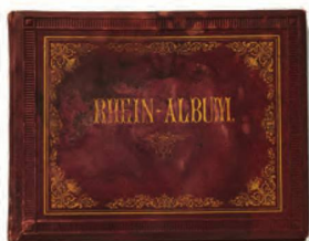
Album des Rheins , ca. 1860