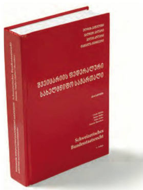
Schweizerisches Bundesstaatsrecht , traduzione in georgiano, 2019