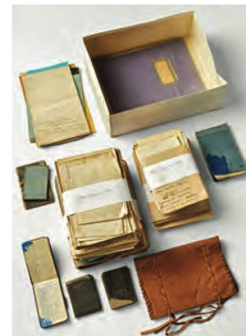
Lascito di Chasper Po

ZYTGLOGGE: è il fondo di Zytglogge Verlag, casa editrice creata a Berna nel 1965 e che poi è divenuta anche etichetta discografica. Il fondo è costituito da circa 1400 supporti audiovisivi (LP, CD, cassette, DVD e VHS) provenienti dal Fondo Zytglogge conservato presso la Burgerbibliothek di Berna.