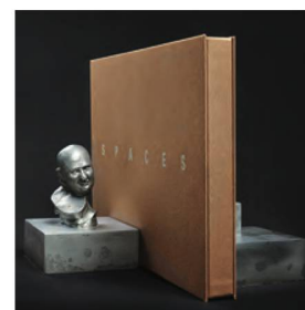
Urs Lüthi, reggilibro, 2011