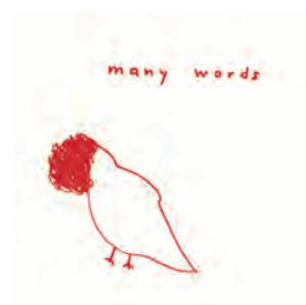
Peter Clemens Brand, many words , 2013, Edizioni Benjamin Dodell