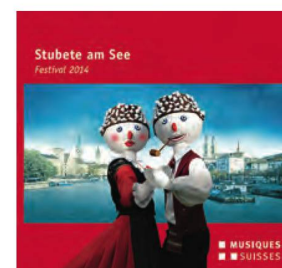
Stubete am See