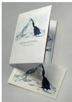
Pugin, Jacques, La montagne s'ombre , 2018