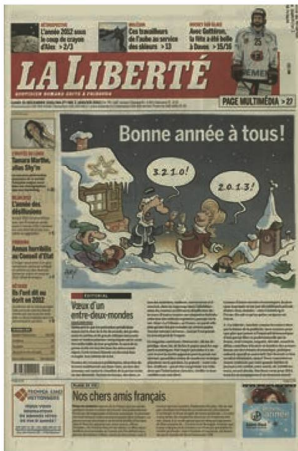
La Liberté, n. 75 (31.12.2012, 1./2.1.2013)

Complessivamente, alla fine del 2017 erano disponibili online 27720 volumi delle collezioni della BN, ciò che costituisce il 7 per mille dei 3951 692 libri e volumi di quotidiani e periodici per un totale di 16,3 milioni di pagine (2016: 14,7 milioni di pagine).