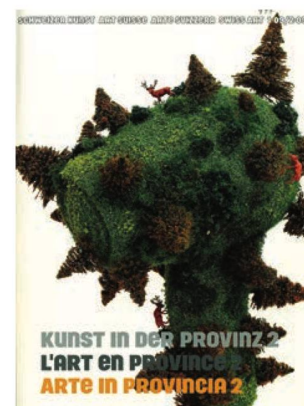
Schweizer Kunst, Nr. 1/2 (2009)

A Berna la BN ha organizzato due mostre: Le lecture di Lenin. Il rivoluzionario alla Biblioteca nazionale e il progetto trinazionale Rilke e la Russia . Entrambe hanno avuto un'ottima risonanza sia di pubblico sia mediatica.