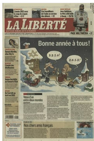
La Liberté, n. 75 (31.12.2012, 1./2.1.2013)

Complessivamente, alla fine del 2017 erano disponibili online 27 720 volumi delle collezioni della BN, ciò che costituisce il 7 per mille dei 3 951 692 libri e volumi di quotidiani e periodici per un totale di 16,3 milioni di pagine (2016: 14,7 milioni di pagine).