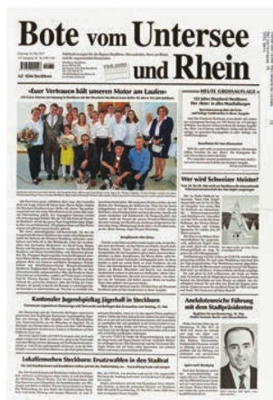
Bote vom Untersee und Rhein, Nr. 38 (16.5.2017)