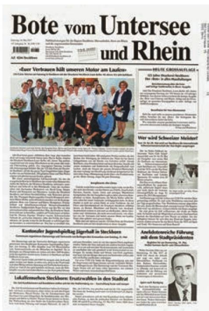
Bote vom Untersee und Rhein, Nr. 38 (16.5.2017)