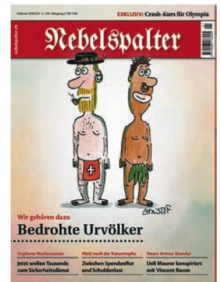
Nebelspalter , 1 (2010)

Nel 2016 l'ASL ha pubblicato un numero della rivista Quarto 18 , mentre il CDN da dato alle stampe quattro nuovi numeri dei Cahiers del CDN 19 di cui gli ultimi due, i numeri 13 e 14, dedicati alle mostre Ionesco – Dürrenmatt. Pittura e Teatro e Jean-Christophe Norman – Stoffe .