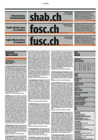
Schweizerisches Handelsamtsblatt , 1 (2014)