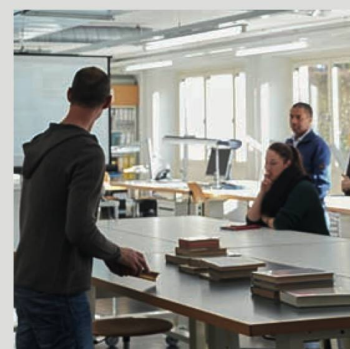
Convegno Monitoraggio conservativo di progetti di digitalizzazione , 17.11.2016

La serata dedicata a Cendrars è risultata da una collaborazione tra l'ASL e il Dipartimento di lingua e letteratura francese dell'Università di Friburgo. L'idea era di offrire a uno scrittore contemporaneo di spicco l'opportunità di presentare la propria lettura di Blaise Cendrars.