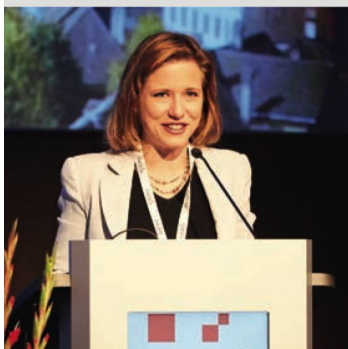
La presidentessa del Consiglio nazionale Christa Markwalder inaugura la iPRES 2016, 3.10.2016

La settimana Accademia estiva organizzata dall'ASL al CDN nell'anno in rassegna aveva l'obiettivo di esplorare il campo delle diverse avanguardie. Lo ha fatto attraverso conferenze, seminari, dibattiti e proiezioni cinematografiche attorno al tema avanguardie e avanguardismi .