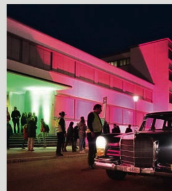
Notte dei musei di Berna, 18.3.2016

Una particolarità della Notte dei musei di Berna è il Fabrendes Museum , una flotta di auto d'epoca che trasporta le visitatrici e i visitatori. Nel 2016 il percorso ha collegato l'Hotel Bellevue alla sede della BN, dove il programma della serata era incentrato sul dadaismo. Ai più giovani è stata offerta la possibilità di partecipare a laboratori di scrittura di poesie e di creazione di maschere in pieno spirito dadaista. Il programma per gli adulti è stato invece dedicato alle due figure centrali del dadaismo ai suoi albori: un'attrice ha letto poesie e testi di Emmy Hennings, mentre nel quadro di un radiodramma sono stati evidenziati tre aspetti della personalità sfuggente di Hugo Ball, ovvero il dadaismo, l'anarchia e il cattolicesimo.