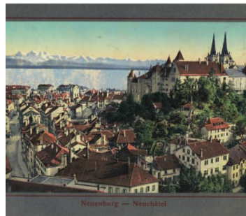
Vue de Neuchâtel, in: Die Schweiz = La Suisse , Neuchâtel, Maison Timothée Jacot, W. Bous, ca. 1900