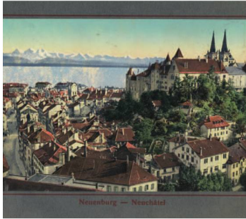
Vue de Neuchâtel, in: Die Schweiz = La Suisse , Neuchâtel, Maison Timothée Jacot, W. Bous, ca. 1900