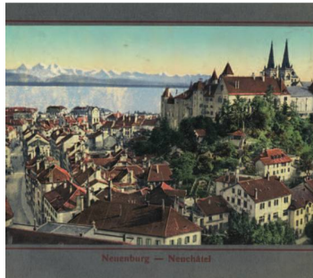
Vue de Neuchâtel, in: Die Schweiz = La Suisse , Neuchâtel, Maison Timothée Jacot, W. Bous, ca. 1900