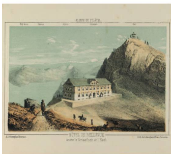
Hôtel Bellevue entre le Kriesiloch et l'Esél, in: Album du Pilâte: collection de 10 vues du Pilâte et de ses environs accompagnée d'un panorama , dess. d'après nature et lith. par Xaver Schwegler, Lucerne: Schwegler & fils, ca. 1865

quali sono state rese accessibili otto testate del diciannovesimo secolo, nonché La Sentinelle (1890–1971) del Cantone di Neuchâtel. Le richieste di ricerca di giornali digitalizzati dalla BN sono più che quintuplicate rispetto all'anno precedente (2013: 15 114; 2014: 83 549) 25 .