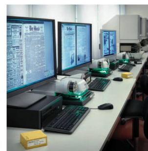
Nuovi scanner per microfilm