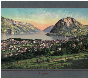
Vue de Lugano, in: Die Schweiz = La Suisse , Neuchâtel, Maison Timothée Jacot, W. Bous, ca. 1900