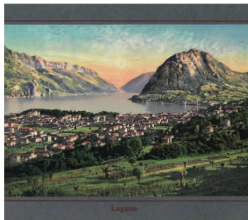
Vue de Lugano, in: Die Schweiz = La Suisse , Neuchâtel, Maison Timothée Jacot, W. Bous, ca. 1900