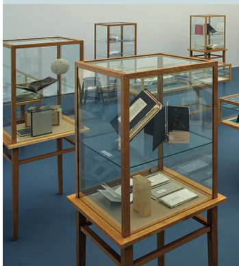
Unikum – Unikat, 22.11.2014– 28.2.2015