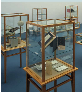
Unikum – Unikat, 22.11.2014– 28.2.2015