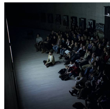
Notte dei musei presso il CDN, 18.5.2013