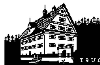
Anton Bruhin, Bündner Bauten , Zurigo, 2012, ed. Marlene Frei, cartella con 8 stampe. Ordine di raffigurazione dall'alto verso il basso: Lumbrin 456 , Trun 463 , Sufers 465 , © dell'artista