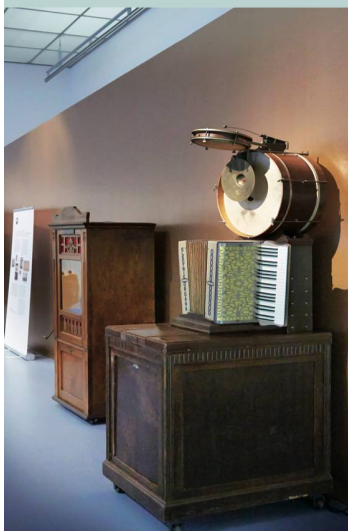
Notte dei musei di Berna, 22.3.2013, Museo degli automi musicali