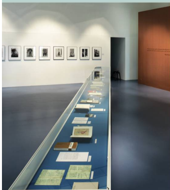
Mostra Lavorando sulle carte , 16.1.–16.2.2013