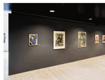
Panoramica della mostra Friedrich Dürrenmatt – Portraits et autoportraits (18.07.–16.09.2012)