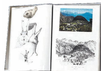
Album di schizzi di Hans Witschi

WITSCHI, Hans, Skizzenbuch 1985–1987 , 1 fascicolo, 1985–1987.