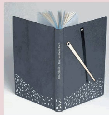
La rilegatura di Luca Stauffer premiata al concorso per rilegatori