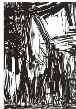
Wolfgang Zät, 2009