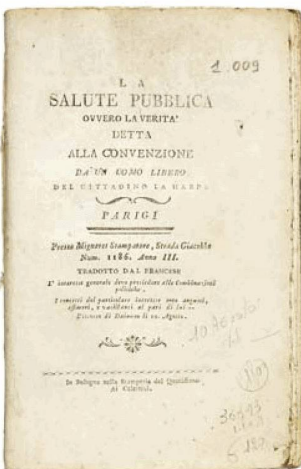
Frédéric César de La Harpe