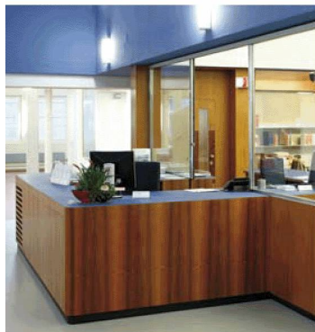
Gli spazi pubblici ristrutturati nella BN: Banco delle informazioni

Alcune collezioni della BN sono ora più facilmente accessibili: i giornali disponibili su microfilm possono essere consultati senza prenotazione e ordinazione, le opere a consultazione libera sulla storia svizzera, sulle letterature svizzere, sull'arte e architettura svizzera e sulle scienze dell'informazione sono state riunite e approfondite nei contenuti.