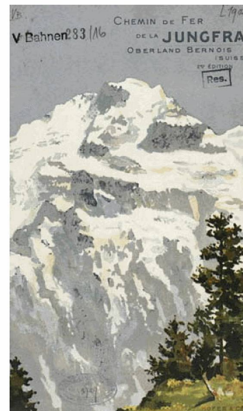
Mostra Reading Europe : Opuscolo delle ferrovie della Jungfrau, 1903

Al Centre Dürrenmatt Neuchâtel la mostra Günter Grass – Bestiarium e le manifestazioni per il decimo anniversario della struttura hanno fatto registrare un forte aumento di pubblico: 12 164 persone contro le 9784 del 2009. I festeggiamenti per i dieci anni sono iniziati il 25 settembre e proseguiranno fino al 2011 14 .