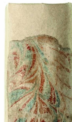
Dopo l'intervento di conservazione: dorso di un libro, manifesti

La collezione di documenti originariamente digitali 15 è aumentata di 2493 pubblicazioni e alla fine del 2009 contava 11 milioni di file per un totale di 136 gigabyte (2008: 1406 pubblicazioni, 15 300 file e 7,91 GB). Va segnalata in particolare l'archiviazione della versione online del Foglio ufficiale svizzero di commercio (FUSC). Il FUSC pubblica quotidianamente circa 1500 registrazioni, che vengono archiviate e conservate a lungo termine dalla BN unitamente alla firma digitale giuridicamente vincolante. In collaborazione con le biblioteche cantonali svizzere, la BN prosegue l'ampliamento della sua collezione di siti web consacrati alla geografia, ai costumi e alla storia svizzeri. Lo sviluppo dell'applicazione che dovrebbe permettere agli utenti di interrogare la banca dati della collezione digitale procede secondo programma. Il nuovo strumento dovrebbe entrare in funzione verso la fine del 2010.