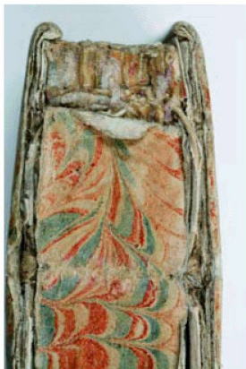
Prima dell'intervento di conservazione: dorso di un libro, manifesti