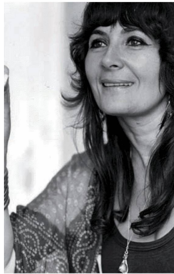
Grisélidis Réal, Diritti riservati

RÉAL, Grisélidis (1929–2005): lascito completo contenente manoscritti di opere, carteggi, fotografie, opere pittoriche, articoli e documenti relativi alla sua lotta in difesa dei diritti delle prostitute. La collezione di opere e documenti sulla prostituzione costituita da Grisélidis Réal è conservata al Centre Grisélidis Réal di Ginevra.