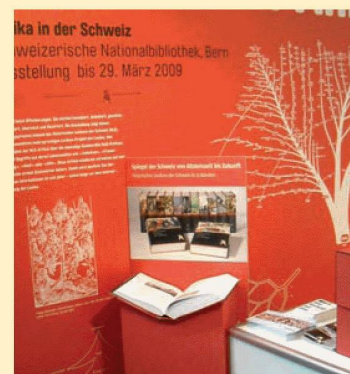
La BN alla fiera del libro Buch.08