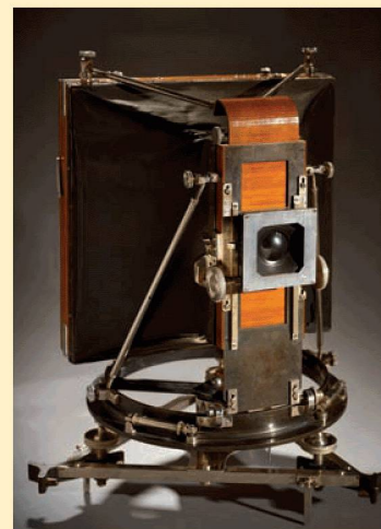
Telecamera fotogrammetrica Meydenbauer