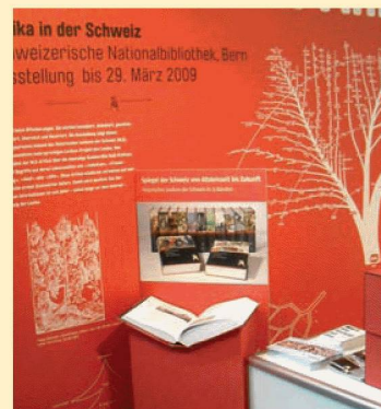
La BN alla fiera del libro Buch.08