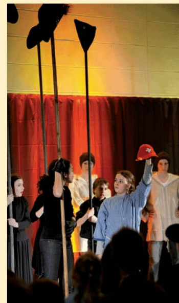
Notte dei musei

I fumetti dell'artista austriaco, esposti al CDN, sono una caricatura dell'odierno atteggiamento nei confronti del glorioso passato imperiale dell'Austria.