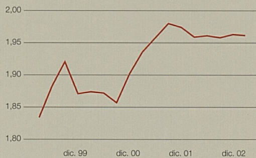
Evoluzione del metà-prezzo in milioni di esemplari.