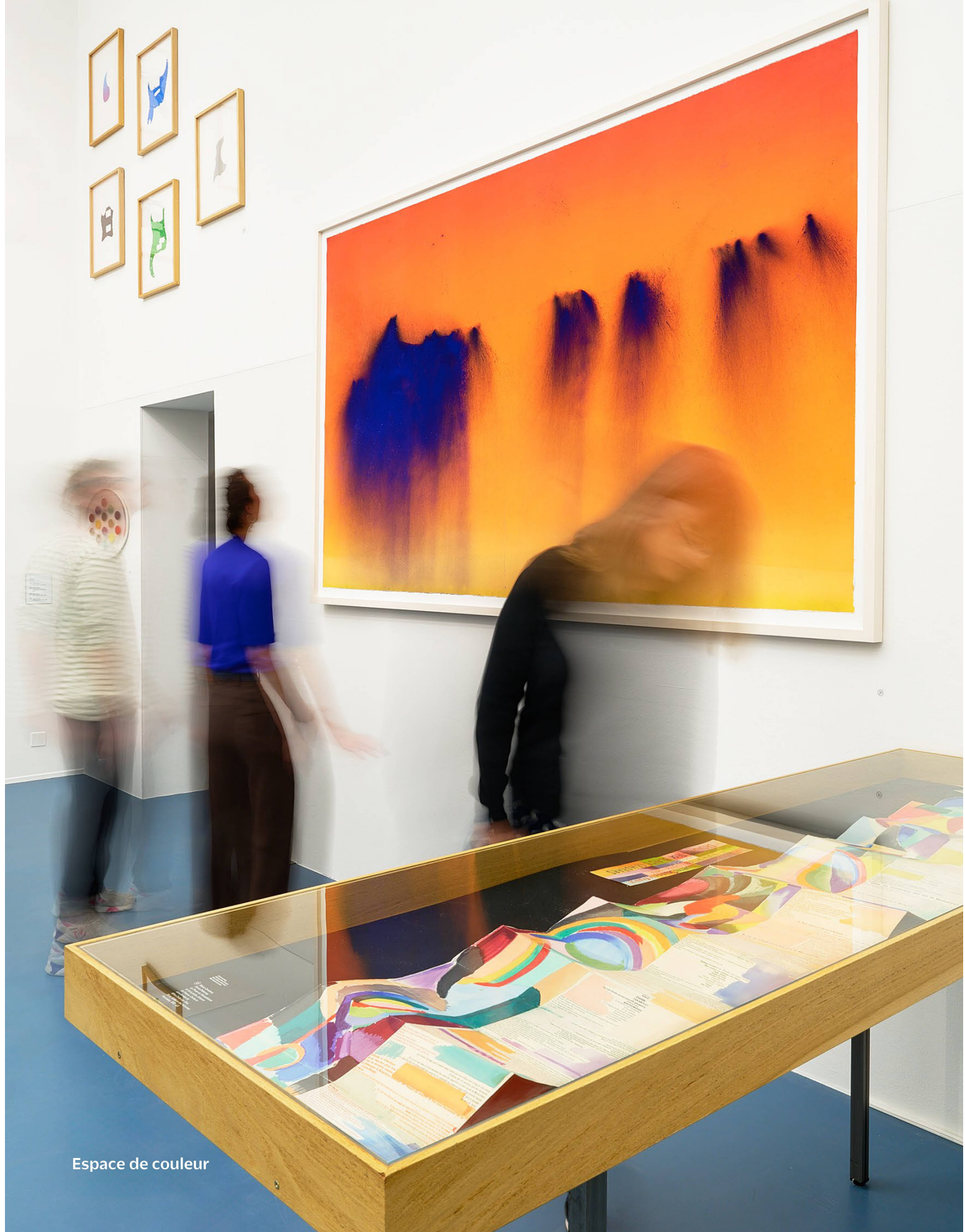
Espace de couleur