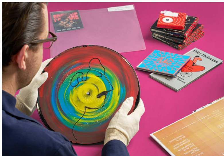
Hansueli von Allmen Matériel provenant des archives

Au cours de l'année sous revue, la Phonothèque nationale a prêté ses œuvres dans le cadre de diverses coopérations. Elle a notamment confié des œuvres au Sils Museum pour l'exposition Sun leivra et au centre d'exposition La Rada à Locarno pour l'exposition Sound echoes, listening spaces .