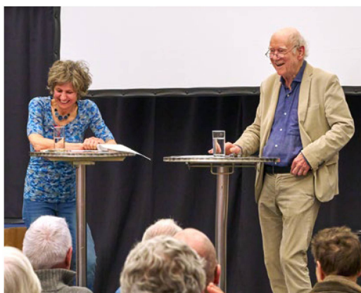
Franz Hohler et Nadeschkin Rétrospective de l'œuvre de F. Hohler et discussion

1968) – dans la salle de lecture de la Bibliothèque nationale ainsi que le vernissage à la villa Morillon de la nouvelle édition des Élégies de Duino de Rilke, premier tome des œuvres intégrales du poète aux éditions Wallstein, ont constitué les moments forts de l'année. Une lecture a eu lieu à cette occasion en présence des éditeurs et de l'équipe éditoriale.