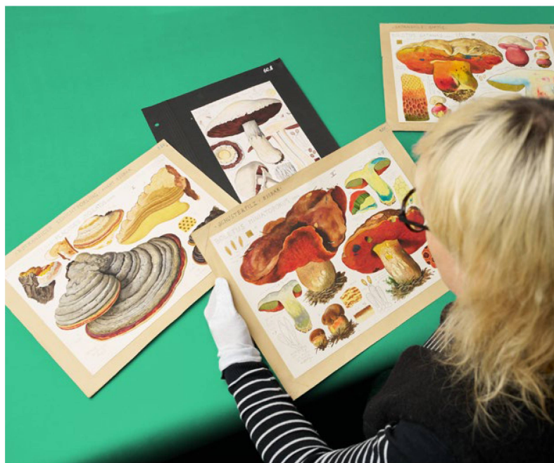
Hans E. Walty Planches de champignons, dessins aquarellés, env. 1925–1930

Durant l'année sous revue, près de 7300 images du Cabinet des estampes relevant du domaine public ont pu être téléchargées sur la plateforme Wikimedia Commons (WMC), faisant ainsi passer le nombre total d'images de la Bibliothèque nationale sur WMC à 23 000. Le nombre de consultations a connu une très bonne évolution par rapport à l'année précédente, atteignant 16,8 millions (13,5 millions en 2022). Les chiffres liés à l'utilisation du site kleinmeister.ch ont également augmenté – on le doit notamment aux nouvelles vitrines virtuelles consacrées d'une part à la thématique du chalet suisse, d'autre part au 175 e anniversaire de la Constitution fédérale.