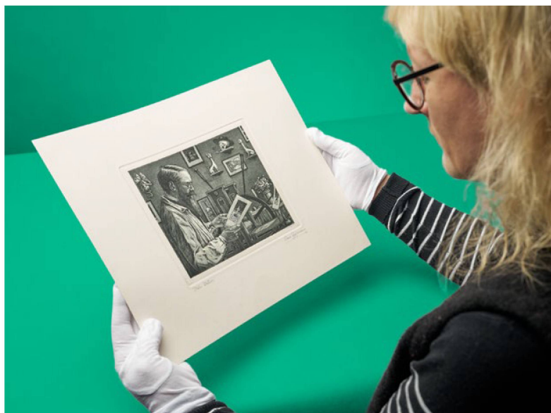
Hans Eggimann Mon atelier , eau-forte, 1917

La Bibliothèque nationale a acquis un ensemble de 80 tirages de Hans Eggimann (1872–1929) – artiste bernois tombé dans l’oubli et représentant du réalisme magique des années 1920 –, en particulier des premières impressions. Pour nos acquisitions de tirages sur le marché de l’art, nous avons tenu compte de la création contemporaine : citons notamment la série Apotheke (A), constituée de quatre cyanotypes réalisés en 2020 par Daniela Keiser (née en 1963), ou encore le lot Murmeli , de Christian Denzler (né en 1966), comprenant des dessins au crayon de couleur achevés en 2023. La collection de portraits a pu être enrichie d’œuvres importantes : outre quelques portraits en estampe (Jean Tinguely, Luciano Castelli, etc.), plus de 100 portraits photographiques sont venus agrandir le fonds. Parmi ces derniers, on trouvera le Clown Dimitri et Bruno