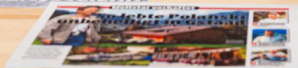
Chalet. Nostalgie, kitsch et culture du bâti