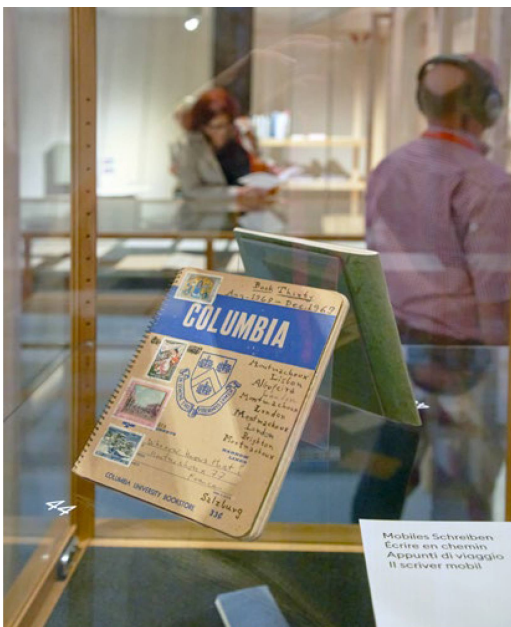
Mobiles Schreiben Ecrire en chemin Appunti di viaggio Il scriver mobil