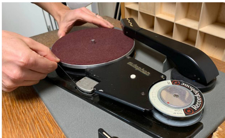
La machine à sons du mois

Le Recordophone d'Autophon SA datant de la fin des années 1940