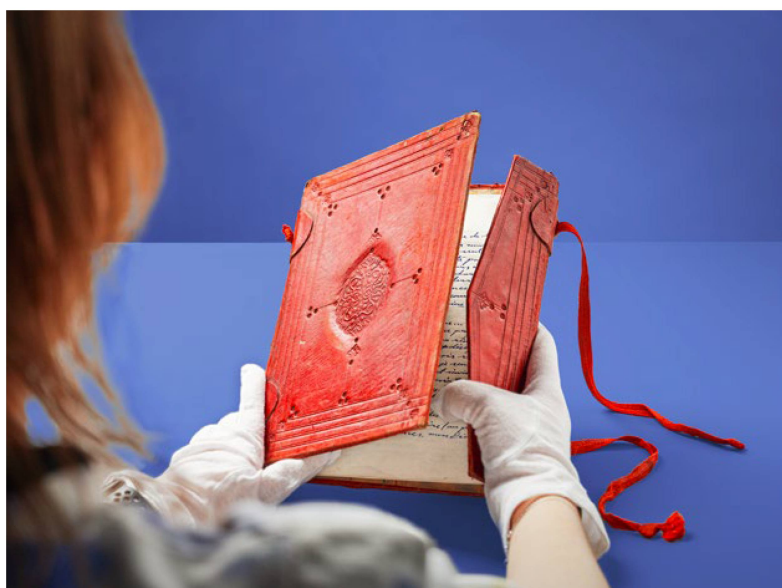
Isabelle Eberhardt Portefeuille venant de la collection Isabelle Eberhardt

différentes versions de ses romans, un dossier de presse, des lettres du public, des distinctions ainsi que quelques dessins et collages. Les archives littéraires de l'écrivain du Vallemaggia (TI) Plinio Martini (1923–1979) sont venues enrichir le fonds de langue italienne, alors que la collection de documents et de manuscrits de l'écrivaine et voyageuse francophone Isabelle Eberhardt (1877–1904) constitue une découverte dont l'importance doit encore être établie.