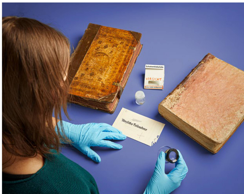
Integrated Pest Management Mesures de lutte contre les nuisibles

La gestion des nuisibles dans les bibliothèques, les archives et les musées, connue sous le nom d' Integrated Pest Management , s'est amplifiée. Dans le cadre des préparatifs du déménagement provisoire de la Bibliothèque nationale, des nuisibles ont été découverts dans les entrepôts de destination ainsi que dans de nouveaux fonds acquis. Comme il faut éviter à tout prix d'introduire des nuisibles dans les collections existantes, les activités préventives de lutte ont été intensifiées.