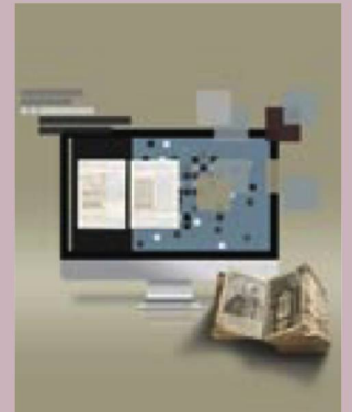
Exposition virtuelle Jean Starobinski. Relations critiques