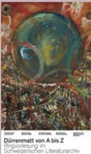
Dürrenmatt von A bis Z: un cycle de quatorze cours

Chaque année, la Digital Preservation Community se réunit pour la conférence internationale iPRES; c'est l'occasion pour les scientifiques et les praticiens de présenter et discuter les tout derniers développements en matière de conservation numérique à long terme. La conférence 2020 n'ayant pu se tenir à cause de la pandémie, les spécialistes se sont rassemblés en ligne au #WeMissiPRES Festival . Pendant trois jours, des centaines de personnes de par le monde se sont connectées pour échanger leurs idées sur les projets en cours. Le festival a établi une passerelle entre la conférence IPRES 2019 et celle reportée à 2021 et a permis ainsi aux discussions de se poursuivre en dépit de la pandémie.