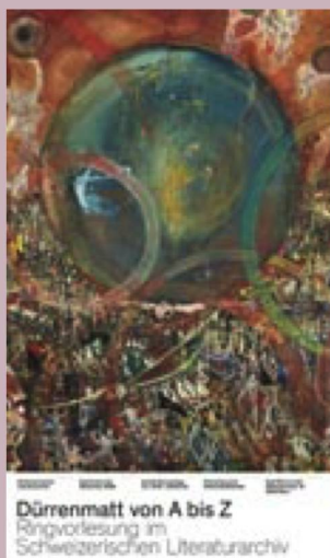
Dürrenmatt von A bis Z: un cycle de quatorze cours

Chaque année, la Digital Preservation Community se réunit pour la conférence internationale iPRES; c'est l'occasion pour les scientifiques et les praticiens de présenter et discuter les tout derniers développements en matière de conservation numérique à long terme. La conférence 2020 n'ayant pu se tenir à cause de la pandémie, les spécialistes se sont rassemblés en ligne au #WeMissiPRES Festival. Pendant trois jours, des centaines de personnes de par le monde se sont connectées pour échanger leurs idées sur les projets en cours. Le festival a établi une passerelle entre la conférence IPRES 2019 et celle reportée à 2021 et a permis ainsi aux discussions de se poursuivre en dépit de la pandémie.