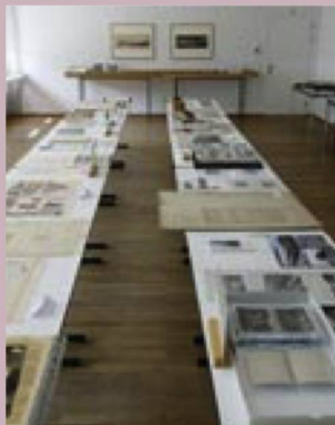
Regard sur l'exposition tenue à l'occasion des Journées européennes du patrimoine