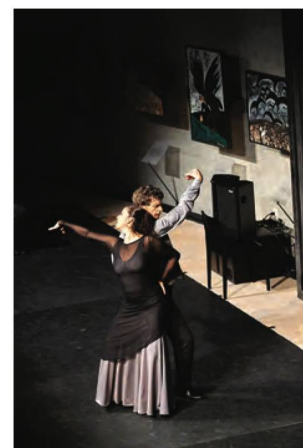
Spectacle de flamenco contemporain Los Laberintos de Dürrenmatt (30.-31.3.2019)