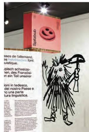
Vue de l'exposition « Helvétismes – spécialités linguistiques » au CDN (14.4.-21.7.2019)

L'année se clôt sur un excellent bilan: les expositions et les manifestations ont été très bien suivies par le public, la médiation culturelle s'est développée de manière positive et les médias ont offert une large couverture aux activités du CDN, avec parfois un écho international. Le CDN a accueilli 12 300 visiteurs en 2019, un chiffre qui figure parmi les meilleurs taux de fréquentation de l'institution depuis sa création.