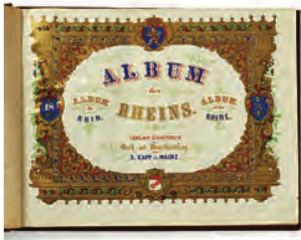
Page de titre, Album des Rheins , vers 1860

On a modifié la pratique en vigueur jusqu'ici dans le traitement des envois de masse en provenance des éditeurs. Ils sont préparés, pourvus d'une cote, entreposés sur leur emplacement définitif dans les magasins souterrains et ne seront indexés que plus tard en suivant une procédure semi-automatique.