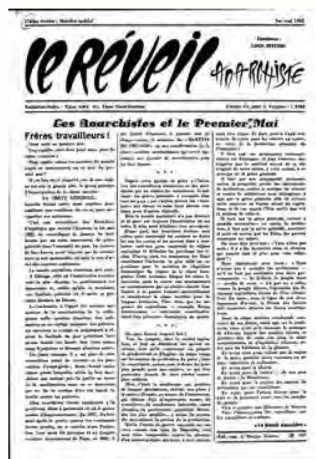
Réveil anarchiste du 1.5.1960

Tout le travail relatif aux acquisitions a été fortement marqué par l'entrée en service du nouveau système de gestion de bibliothèque. Sa mise en place au service Acquisitions Monographies