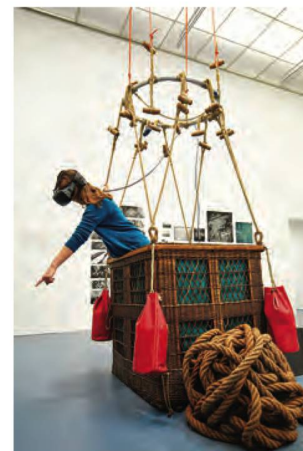
Les visiteurs de l'exposition ont pu vivre un voyage en ballon grâce à des lunettes de réalité virtuelle

Les manifestations culturelles de la BN à Berne ont accueilli 7632 personnes, un chiffre très nettement inférieur à 2018 qui a été une année exceptionnelle, avant tout grâce à l'exposition LSD. Les 75 ans d'un enfant terrible . L'exposition Vu du ciel. Du ballon de Spelterini au drone a permis de faire un voyage virtuel en ballon grâce aux collections de la BN.