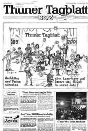
Thuner Tagblatt du 31.12.1999

Trois facteurs ont particulièrement marqué les activités et les résultats de la collection générale: le travail avec le nouveau système de gestion de bibliothèque, les effets générés par l'état du bâtiment et l'orientation des activités en fonction de la nouvelle stratégie (en vigueur depuis 2020).