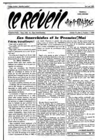
Réveil anarchiste du 1.5.1960

Tout le travail relatif aux acquisitions a été fortement marqué par l'entrée en service du nouveau système de gestion de bibliothèque. Sa mise en place au service Acquisitions Monographies