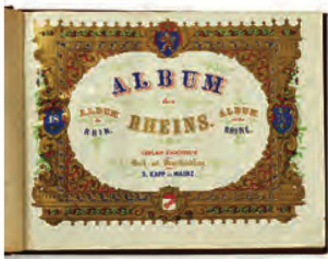
Page de titre, Album des Rheins , vers 1860

On a modifié la pratique en vigueur jusqu'ici dans le traitement des envois de masse en provenance des éditeurs. Ils sont préparés, pourvus d'une cote, entreposés sur leur emplacement définitif dans les magasins souterrains et ne seront indexés que plus tard en suivant une procédure semi-automatique.