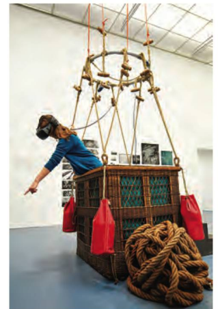
Les visiteurs de l'exposition ont pu vivre un voyage en ballon grâce à des lunettes de réalité virtuelle

Les manifestations culturelles de la BN à Berne ont accueilli 7632 personnes, un chiffre très nettement inférieur à 2018 qui a été une année exceptionnelle, avant tout grâce à l'exposition LSD. Les 75 ans d'un enfant terrible . L'exposition Vu du ciel. Du ballon de Spelterini au drone a permis de faire un voyage virtuel en ballon grâce aux collections de la BN.