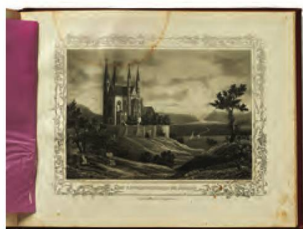
Illustration, Album des Rheins , vers 1860

En 2019, la BN comptait 4716 utilisateurs actifs. Dans le nouveau système de gestion de bibliothèque, on arrive à ce chiffre par d'autres calculs que dans le système antérieur; on ne peut ainsi le comparer avec le résultat de l'année précédente. On saisit les utilisateurs qui se sont connectés une fois au moins à l'interface de recherche Primo VE. Le nombre des documents prêtés a connu une augmentation pour la première fois depuis des années, une augmentation réjouissante de 18 %. Un total de 67 012 documents a ainsi été prêtés (56 615 en 2018).