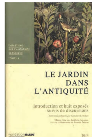
Entretiens sur l'antiquité classique vol. 60, 2014

Près de 53 000 nouvelles acquisitions ont bénéficié d'un traitement conservatoire, soit une baisse de 2,9 % par rapport à 2018. On a confectionné 3207 étuis de protection, environ 6,1 % de moins que l'année précédente. Les retards consécutifs à la mise en place du nouveau système de gestion de bibliothèque ont eu un impact sur les fonds qui, à l'interne ou au dehors, devaient être pourvus d'une reliure. Moins d'objets que l'année dernière ont pu recevoir un traitement. Il a fallu apporter des réparations à 361 publications, ce qui représente une hausse de 27,6 % par rapport à 2018.