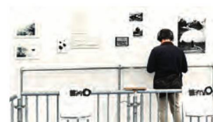
Photographies prises avec des drones