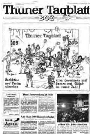
Thuner Tagblatt du 31.12.1999

Trois facteurs ont particulièrement marqué les activités et les résultats de la collection générale: le travail avec le nouveau système de gestion de bibliothèque, les effets générés par l'état du bâtiment et l'orientation des activités en fonction de la nouvelle stratégie (en vigueur depuis 2020).