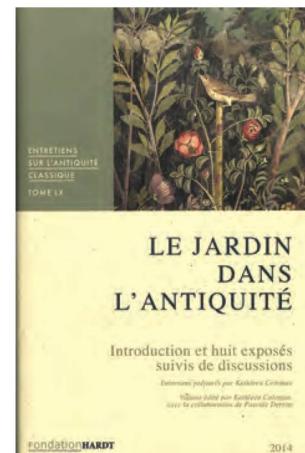
Entretiens sur l'antiquité classique vol. 60, 2014

Près de 53 000 nouvelles acquisitions ont bénéficié d'un traitement conservatoire, soit une baisse de 2,9 % par rapport à 2018. On a confectionné 3207 étuis de protection, environ 6,1 % de moins que l'année précédente. Les retards consécutifs à la mise en place du nouveau système de gestion de bibliothèque ont eu un impact sur les fonds qui, à l'interne ou au dehors, devaient être pourvus d'une reliure. Moins d'objets que l'année dernière ont pu recevoir un traitement. Il a fallu apporter des réparations à 361 publications, ce qui représente une hausse de 27,6 % par rapport à 2018.