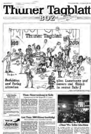
Thuner Tagblatt du 31.12.1999

Trois facteurs ont particulièrement marqué les activités et les résultats de la collection générale: le travail avec le nouveau système de gestion de bibliothèque, les effets générés par l'état du bâtiment et l'orientation des activités en fonction de la nouvelle stratégie (en vigueur depuis 2020).