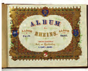
Page de titre, Album des Rheins , vers 1860

On a modifié la pratique en vigueur jusqu'ici dans le traitement des envois de masse en provenance des éditeurs. Ils sont préparés, pourvus d'une cote, entreposés sur leur emplacement définitif dans les magasins souterrains et ne seront indexés que plus tard en suivant une procédure semi-automatique.