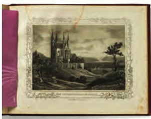
Illustration, Album des Rheins , vers 1860

e-Newspaperarchives.ch , la plateforme des journaux numérisés a comptabilisé près de 215 000 appels, soit une augmentation de 41% par rapport à l'exercice précédent. Importante pour la présentation iconographique, l' International Image Operability Framework iif a été intégrée en tant que norme à e-Newspaperarchives en avril 2019. En novembre, une opération de crowdsourcing (appel à une large participation) a été menée avec succès: près de 130 personnes intéressées ont revu et corrigé 72 408 lignes d'articles de journaux numérisés à l'occasion du 60 e anniversaire du refus du droit de