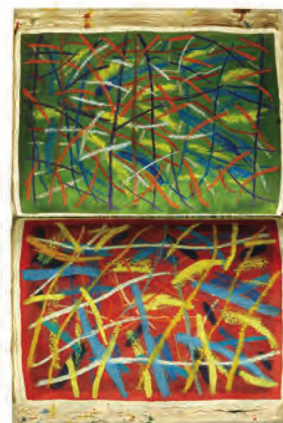
Christoph Hauri, Grosses Malbuch , livre d'artiste à exemplaire unique, 2003