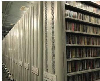
La collection de la Phonothèque contient notamment un grand nombre de CD