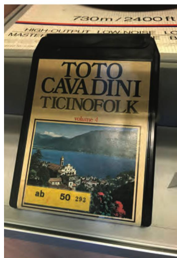
La Phonothèque collectionne également des supports historiques, comme les Stereo-8