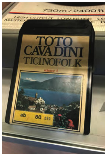
La Phonothèque collectionne également des supports historiques, comme les Stereo-8