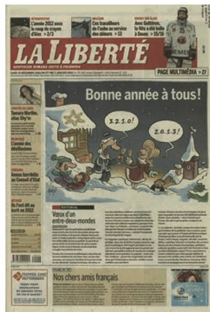
La Liberté, n° 75 (31.12.2012, 1/2.1.2013)

La BN ne cesse de numériser des fonds. Pour la première fois, elle a chargé des documents sur la plateforme e-manuscripta. Tous les manuscrits de Rainer Maria Rilke détenus par les Archives littéraires suisses y sont désormais accessibles.