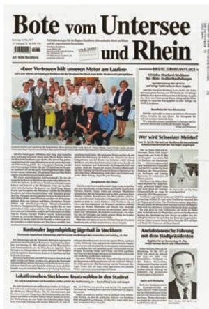
Bote vom Untersee und Rhein, n° 38 (16.5.2017)