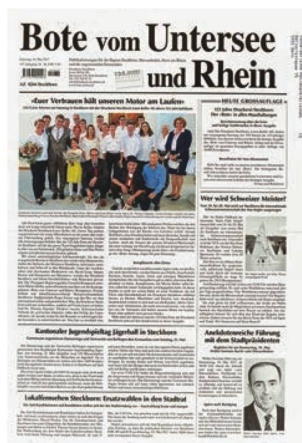
Bote vom Untersee und Rhein, n° 38 (16.5.2017)

L'atelier photographique de la BN est un centre de compétence reconnu en matière de numérisation, de photographie et de reprographie ; il dispose également d'infrastructures novatrices. De