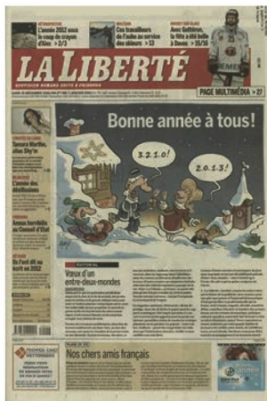
La Liberté, n° 75 (31.12.2012, 1/2.1.2013)

L'atelier photographique de la BN est un centre de compétence reconnu en matière de numérisation, de photographie et de reprographie ; il dispose également d'infrastructures novatrices. De