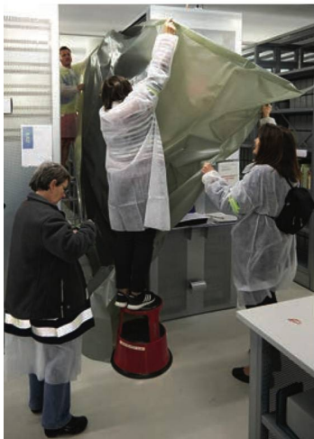
Exercice de mise en œuvre du plan catastrophe, 5.7.2017

En préparation à la migration, la qualité des données a été examinée dans les applications concernées; un nettoyage a été fait là où cela était nécessaire. Les données sont désormais toutes codées d'après la norme internationale MARC21 et correctement reliées avec la Gemeinsame Normdatei GND. Cette étape était non seulement un prérequis pour la migration, mais une condition pour l'interopérabilité des données de la BN.