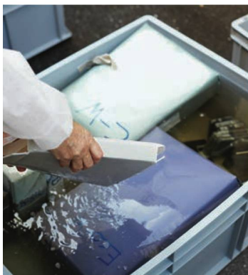
Exercice de mise en œuvre du plan catastrophe, 5.7.2017