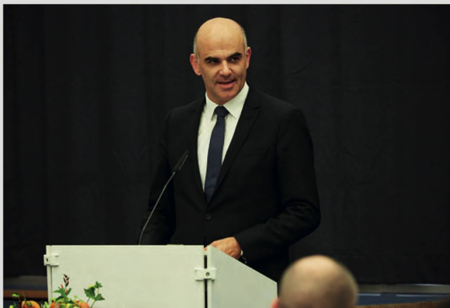
Le conseiller fédéral Alain Berset prononce une allocution lors de l'inauguration de l'exposition Rilke et la Russie à Berne.