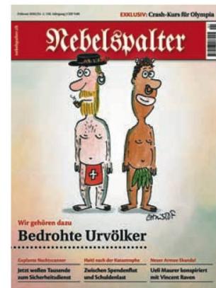
Nebelspalter , 1 (2010)

Les ALS ont publié en 2016 un numéro de leur revue Quarto 18 et le CDN quatre numéros des Cahiers du CDN 19 . Les deux derniers Cahiers du CDN , les numéros 13 et 14, se rapportent à deux expositions du Centre, Ionesco - Dürrenmatt. Peinture et théâtre et Jean-Christophe Norman – Matières .