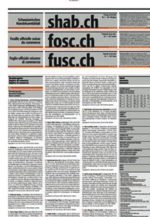
Feuille officielle suisse du commerce, 1 (2014)