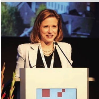
Christa Markwalder, présidente du Conseil national, ouvre officiellement iPRES2016, 3.10.2016

La septième Académie d'été des ALS au CDN s'est donné pour tâche de parcourir le domaine des avant-gardes. Des conférences, des séminaires, des débats publics et des projections de films ont été consacrés au thème des avant-gardes et de l'avant-gardisme.