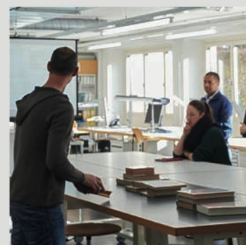
Colloque Suivi conservatoire des projets de numérisation , 17.11.2016.

Cette soirée consacrée à Cendrars était le fruit d'une collaboration entre les ALS et le Département de langues et littératures (Domaine Français) de l'Université de Fribourg. Il s'agissait de donner à un écrivain contemporain majeur l'occasion de présenter sa propre lecture de Blaise Cendrars.