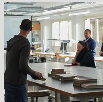
Colloque Suivi conservatoire des projets de numérisation , 17.11.2016.

Cette soirée consacrée à Cendrars était le fruit d'une collaboration entre les ALS et le Département de langues et littératures (Domaine Français) de l'Université de Fribourg. Il s'agissait de donner à un écrivain contemporain majeur l'occasion de présenter sa propre lecture de Blaise Cendrars.