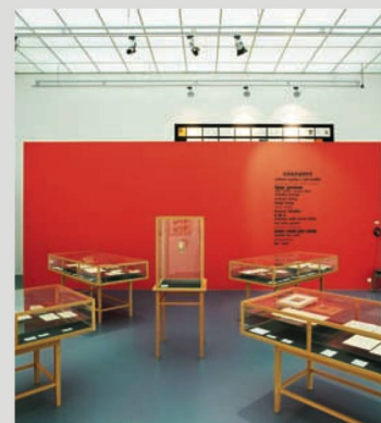
DADA original, 7.3.–28.5.2016

Un choix de portraits photographiques montrant la diversité des facettes et visages d'Emmy Hennings a constitué un point fort de l'exposition. Des documents de l'Arche Verlag à Zurich ont donné encore un aperçu de l'histoire de la réception du post-dadaïsme.