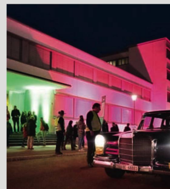
Nuit des musées de Berne, 18.3.2016

L'une des attractions de la Nuit des musées de Berne est le Musée roulant , une flotte de vieilles limousines emmenant les visiteurs. En 2016, l'itinéraire partait du Bellevue et finissait à l'entrée de la BN. Là, le dadaïsme était au programme. Des ateliers ont permis aux enfants d'écrire des poèmes et de bricoler des masques dada. Le programme pour les adultes était consacré à deux figures essentielles des débuts du dadaïsme : une comédienne a lu des poèmes et des textes d'Emmy Hennings, et une réalisation scénique et radiophonique a mis en lumière trois aspects de la personnalité chatoyante de Hugo Ball, à savoir le dadaïsme, l'anarchisme et le catholicisme.