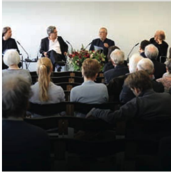
Vernissage Quarto Graz sei Dank ! 18.5.2016