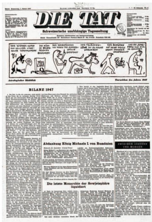
Die Tat, 1.1.1948

Sur retro.seals.ch 25 , la plateforme nationale des revues numérisées, 53 titres provenant de la BN sont disponibles, ce qui correspond à 15 % de l'ensemble du contenu du site. Onze de ces titres ont été mis en ligne en 2015. Le plus important d'entre eux, et le plus demandé, est le Nebelspalter , dont on peut consulter les 100 premières années (1875–1974). L'une des plus belles de ces revues est Cratschla: Informationen aus dem Schweizer Nationalpark (1992–2013). Les années suivantes de ces deux revues seront mises à disposition ultérieurement. La revue Sprachspiegel est également disponible sur le site, de son premier volume (1945) jusqu'aux numéros récents, seuls les numéros des 24 derniers mois étant exclus de la consultation en ligne.