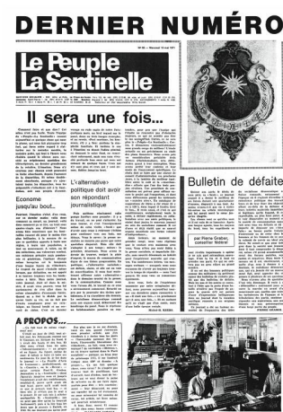
« Une » du dernier numéro de Le Peuple La Sentinelle , édition Neuchâtel-Jura, 19 mai 1975