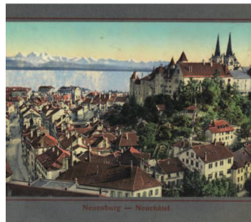
Vue de Neuchâtel, in: Die Schweiz = La Suisse , Neuchâtel, Maison Timothée Jacot, W. Bous, vers 1900.