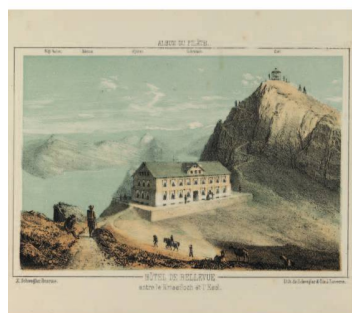
Hôtel Bellevue entre le Kriesloch et l'Esél, in: Album du Pilâte: collection de 10 vues du Pilâte et de ses environs accompagnée d'un panorama , dess. d'après nature et lith. par Xaver Schwegler, Lucerne: Schwegler & fils, vers 1865.

Parmi les autres plateformes qui sont alimentées par la BN, il convient de mentionner www.presse-suissearchives.ch 23 pour les journaux et retro.seals.ch 24 pour les revues. La première s'est récemment enrichie de journaux du canton de Saint-Gall, dont huit titres du XIX e siècle sont désormais disponibles, et du canton de Neuchâtel, avec La Sentinelle (1890–1971). Le nombre d'accès aux journaux numérisés par la BN a plus que quintuplé par rapport à l'année précédente (15 114 en 2013; 83 549 en 2014) 25 .