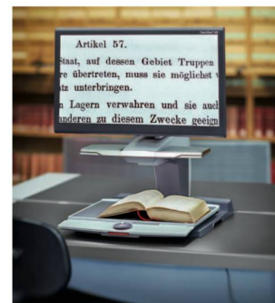
Poste de travail pour les personnes malvoyantes.

Un de nos objectifs stratégiques est de mettre nos documents à la disposition du plus grand nombre de personnes intéressées; dans ce but, nous avons engagé deux Wikipedians in Residence en collaboration avec l'association Wikimedia Suisse. Ces spécialistes ont mis en ligne un premier lot d'images libres de droits provenant du Cabinet des estampes. En décembre 2014, 784 images du CE étaient ainsi disponibles sur Wikimedia Commons 22 . Les articles contenant des images de la BN ont été consultés 475 154 fois, ce qui met en évidence l'énorme portée de Wikipédia.