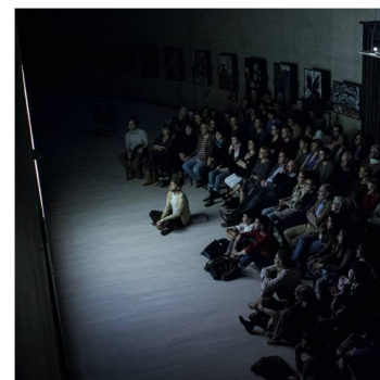
Nuit des Musées au CDN, 18.5.2013