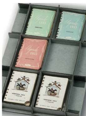
Les carnets d'Alice Ceresa des années 1950 contiennent les premières traces de La figlia prodiga .

Ces images proviennent de Quarto 37, Scelte di una generazione . Prosatori della Svizzera italiana nel secondo Novecento. Les documents reproduits se trouvent dans les archives et fonds correspondants des ALS.