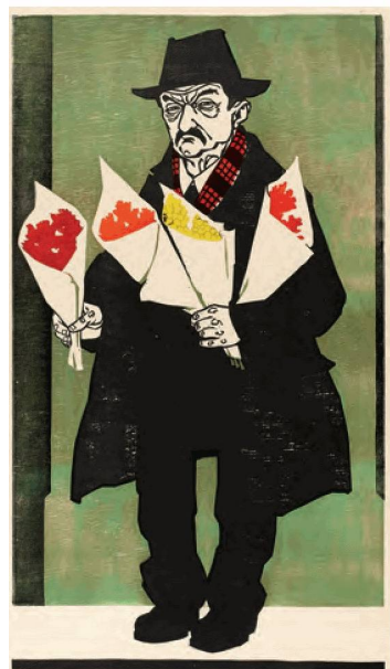
Emil Zbinden, Der Blumenverkäufer , gravure sur bois en couleurs, 1955

ZÜST, Andreas (1947–2000): les archives de portraits du photographe, artiste total, naturaliste et éditeur Andreas Züst contiennent des photos analogiques, des diapositives, des copies par contact, des négatifs noir/blanc et couleur des années 1970 à 1990, des DVD, des données numériques et une importante documentation sur l'œuvre. (donation Mara Züst)