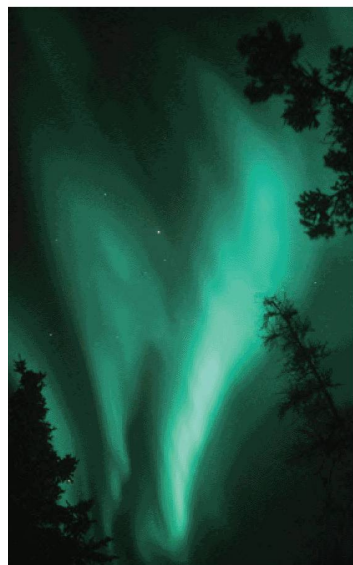
Andreas Züst, [sans titre], diapositive, 1991