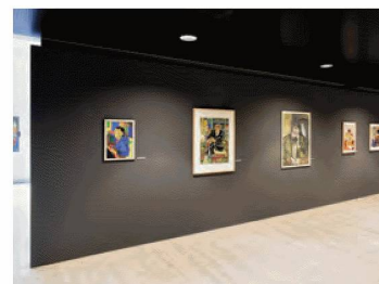
Vue de l'exposition Friedrich Dürrenmatt – Portraits et autoportraits (18.07–16.09.2012)