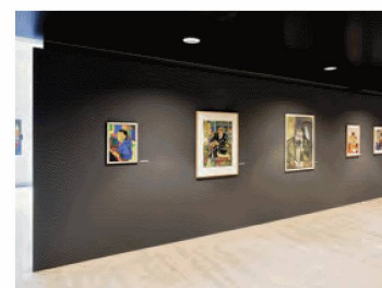
Vue de l'exposition Friedrich Dürrenmatt – Portraits et autoportraits (18.07–16.09.2012)