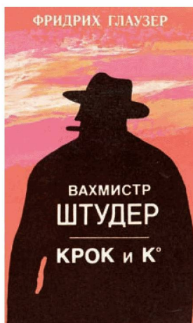
Wachtmeister Studer en russe : Sankt Petersburg, Kult-inform-press, 1992, Sig. Nb 61124