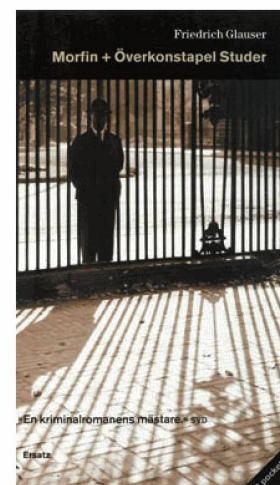
Wachtmeister Studer de Friedrich Glauser en suédois: Stockholm, Ersatz, 2008, Sig. N 290626

La norme d'échange commune Gemeinsame Normdatei (GND) de la Bibliothèque nationale allemande marque une étape supplémentaire vers la standardisation. La GND réunit les différentes règles de catalogage dans un instrument commun. La GND sera introduite pour l'indexation matières dès le printemps de 2012. Il est également prévu d'appliquer la GND au catalogue alphabétique, mais des études restent à faire à ce sujet. La GND remplacera notamment la Schlagwort-Normdatei (SWD) dont la BN a pendant longtemps géré le seul centre de clearing en Suisse. Dans